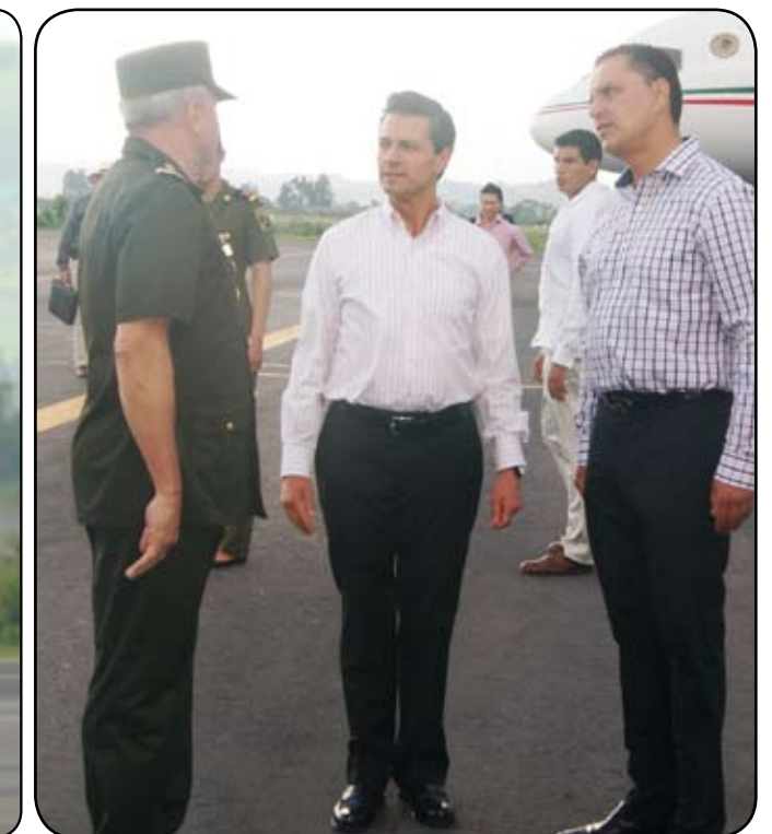
*Bienvenido Peña Nieto a Nayarit