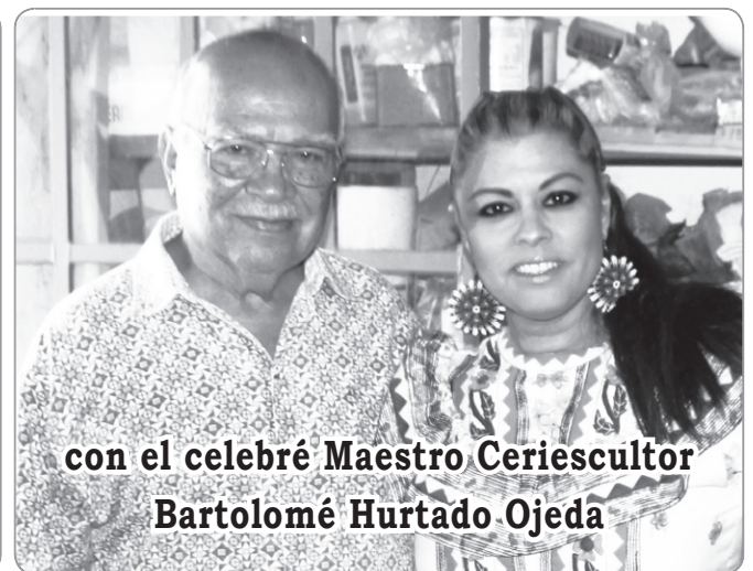
con el celebré Maestro Ceriescultor Bartolomé Hurtado Ojeda