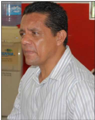
Por Oscar Bueno