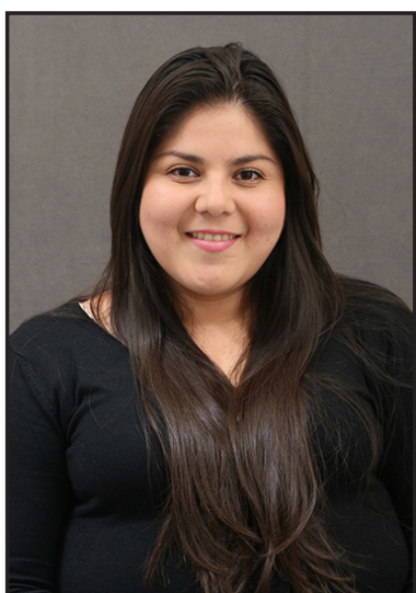
Por: MARIO LUNA

(NO se autoriza la transcripción o copia de esta información a otros medios de comunicación.)