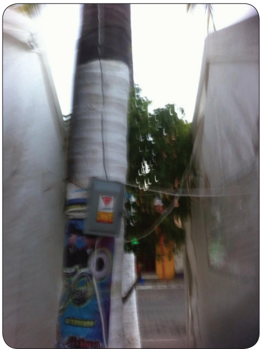
tu casa, aseguró. “comento el caso porque mi