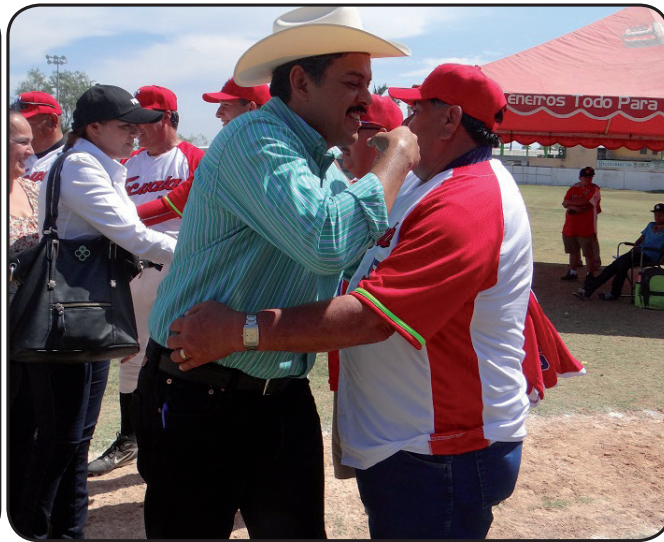
por su gran esfuerzo de cada año convivir y reunirse con sus compatriotas, y es bueno