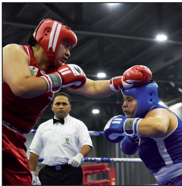
Ortiz vuelve a conquistar medalla de oro como lo hiciera en el 2011,