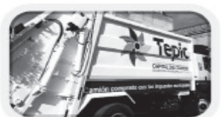
Turno de Recolección Nocturno 20:00 a 02:00 hrs. de lunes a sábado