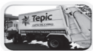
Turno de Recolección Matutino 07:00 a 14:00 hrs. de lunes a sábado