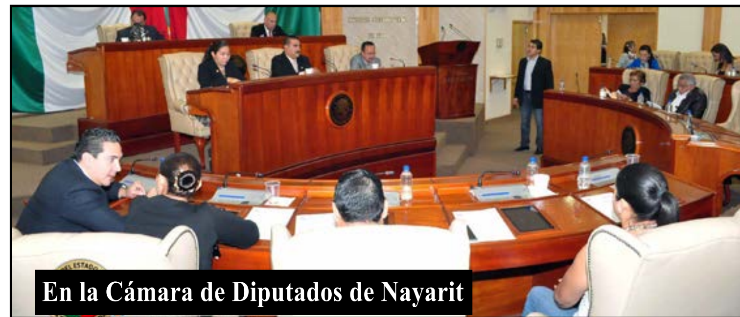
En la Cámara de Diputados de Nayarit