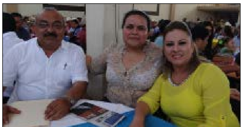
Por Pedro Bernal/ Gente y Poder