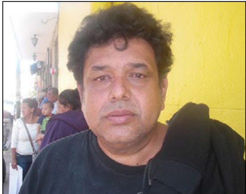
Por José María Castañeda

La última edición estuvo sorprendente, mira el video: https://www.youtube.com/watch?v=QUngja2eCQM