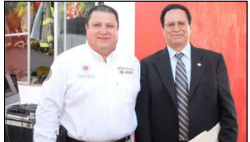
la noble tarea de servir a sus semejantes en caso de emergencias. En nombre del Cuerpo de Bomberos del puerto de Veracruz, en el año 1873.

*El Gobernador Roberto Sandoval les hizo llegar uniformes y estímulos económicos