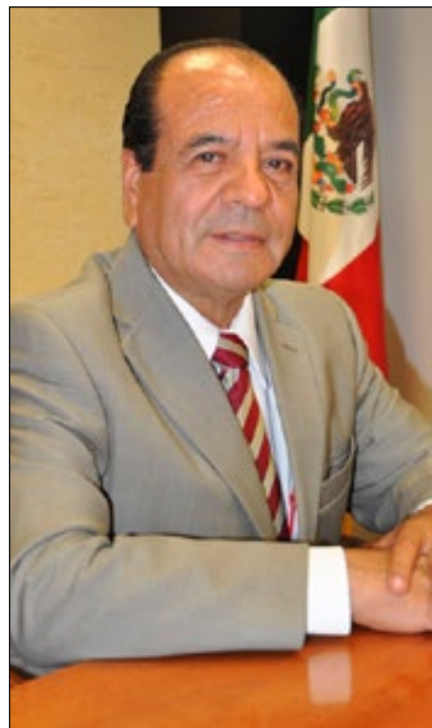
Por Juan Carlos Ceballos

*A pesar de que MORENA, un partido político que ni siquiera tiene representación en el Congreso del Estado, se quiso aprovechar de la circunstancia, no lo logró y el Fallo de la Corte, fue favorable a la reforma político-electoral, que hiciera La Cámara de Diputados