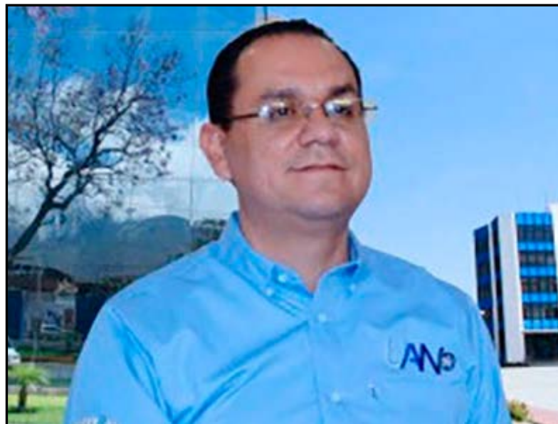
En torno al 48 aniversario de la Autónoma de Nayarit indicó que la exposición fotográfica expuesta en el Paseo de las Artes, forma parte de una

En lo que el rector de la UAN incidió en respetar la autonomía total de la Federación de Estudiantes para la elección de sus Consejeros” que en el marco de lo establecido por la UAN espero que sean procesos democráticos, plurales e incluyentes”.