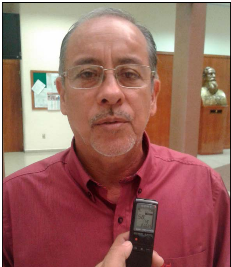
Por Pedro Amparo Medina

También estará a disposición de los trabajadores del Instituto el curso en línea SER, que permitirá reforzar lo ya aprendido en forma presencial, y brindará más herramientas para el manejo de conflictos, reducción del estrés y mejora en general de la calidad de vida.