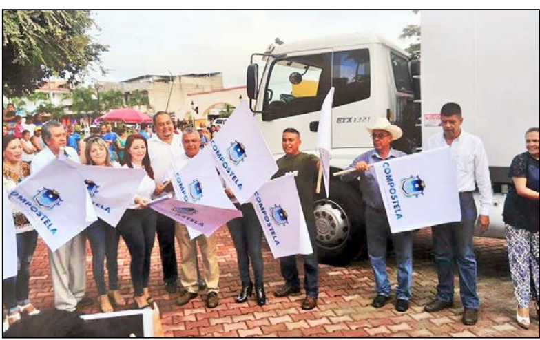
se implementará también un sistema de conciencia

Me siento contenta—afirmó—de estar en este lugar, fortalecida con la presencia de los regidores y regidoras para dar respuesta a los planteamientos de la gente