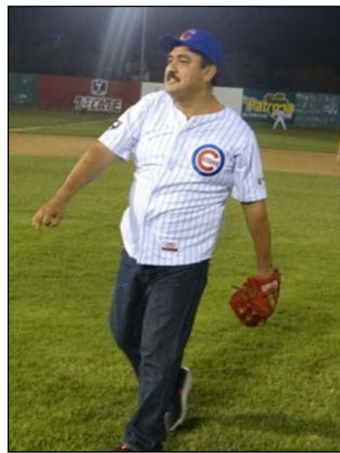
Genteypoder/Acaponeta