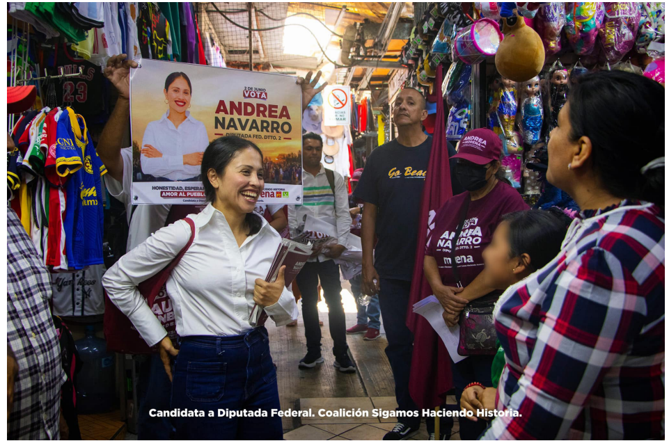
Candidata a Diputada Federal. Coalición Sigamos Haciendo Historia.