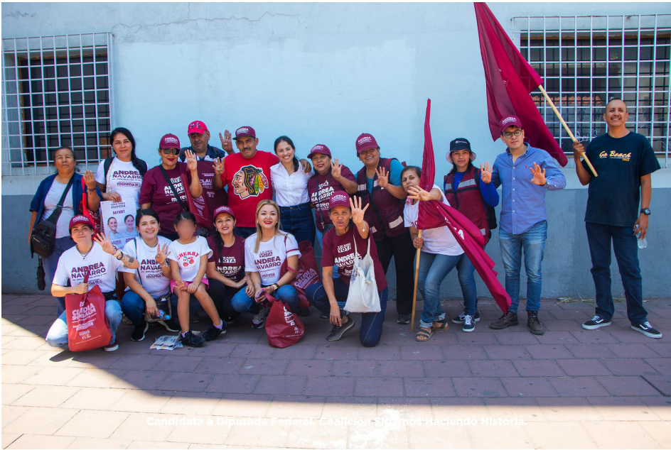
Candidata a Diputada Federal. Coalición Sigamos Haciendo Historia.