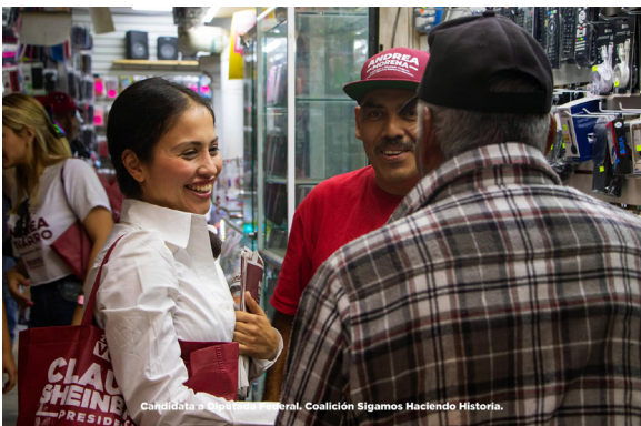
Candidata a Diputada Federal. Coalición Sigamos Haciendo Historia.

Además, aprovechamos la ocasión para compartir periódicos y discutir las propuestas del proyecto de nación que tienen el potencial de impulsar las economías locales. Es gratificante ver cómo se fomenta el intercambio de ideas y se promueve el desarrollo de la región a través de iniciativas colaborativas como estas. Sin duda, una experiencia enriquecedora que nos deja con un mayor sentido de conexión y compromiso con nuestra comunidad.