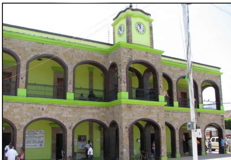
trabajar, no tendrá excusa ni pretexto alguno, gracias a esta buena

estatal y hasta ahorita es el tercer municipio menos endeudado, por eso la administración entrante ya no tendrá los problemas que tuvo el presidente actual que tuvo que remar contra corriente para poder llevar el barco a buen término, así es que habrá finanzas sanas para el presidente que estará después del 17 de septiembre y con esto no podrá decir que no va a poder