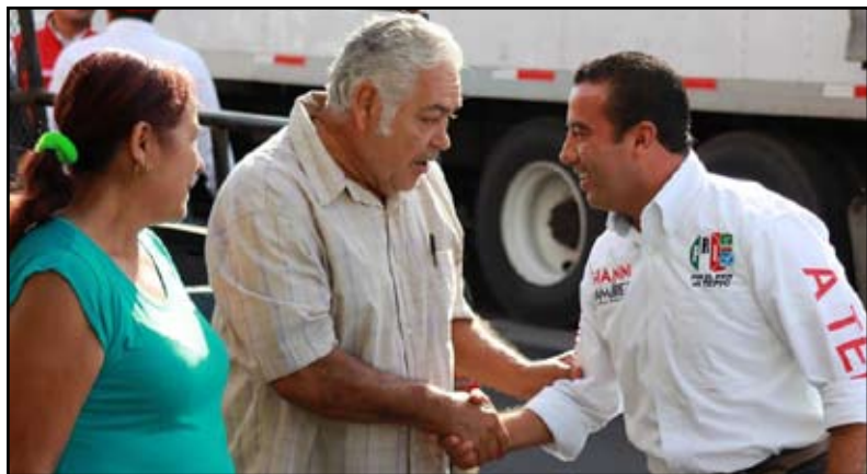
Por Juan Carlos Ceballos

Tepic.- Que triste que haya quien piense que destruir cuando todos podemos construir y eso se nota con la destrucción de mis pendones y espectaculares, pensando en que si rompen mi propaganda tendré menos votos, pero por el contrario, con ello la ciudadanía sabe de qué parte está el vandalismo y de cual está la cordura y el trabajo de campaña, porque esos acciones no pueden detenerme cuando estoy convencido que voy muy delante de todos los candidatos que