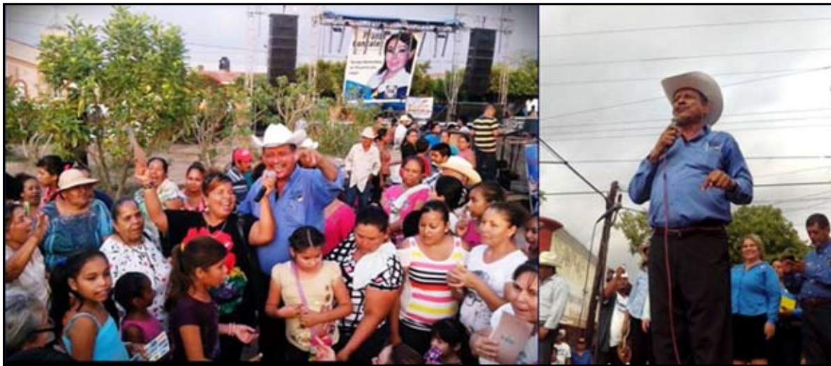
*En San Vicente municipio de Rosamorada