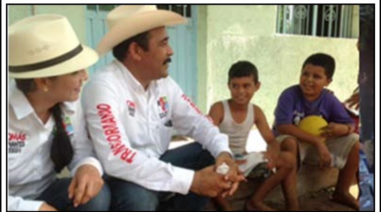
Por Ramón García

Gran afluencia de electores la tarde de ayer martes en su visita de proselitismo político por esas localidades del municipio de Rosamorada, cada día se unen cientos de priistas al proyecto de desarrollo que integrará a partir del próximo 6 de julio, Rosamorada debe cambiar, es tiempo de darle una nueva cara, por tal razón los electores le dan el voto de confianza y que no los defraude en la próxima administración.