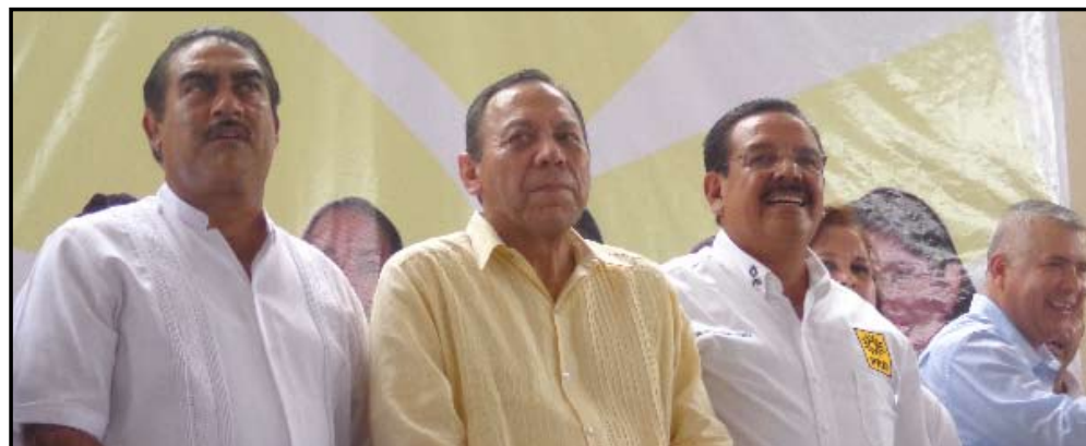
Pedro Bernal/ Gente y Poder