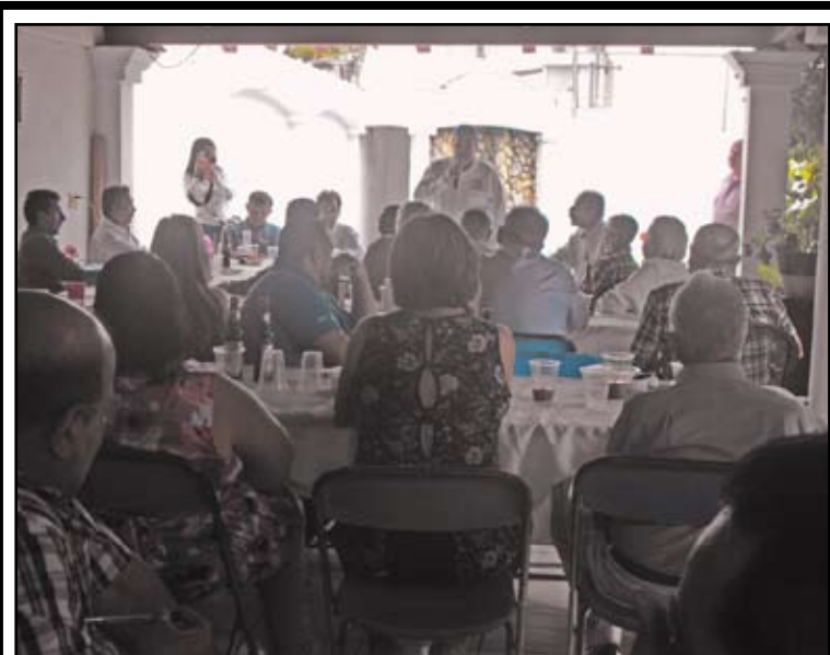
*En agradable reunión...