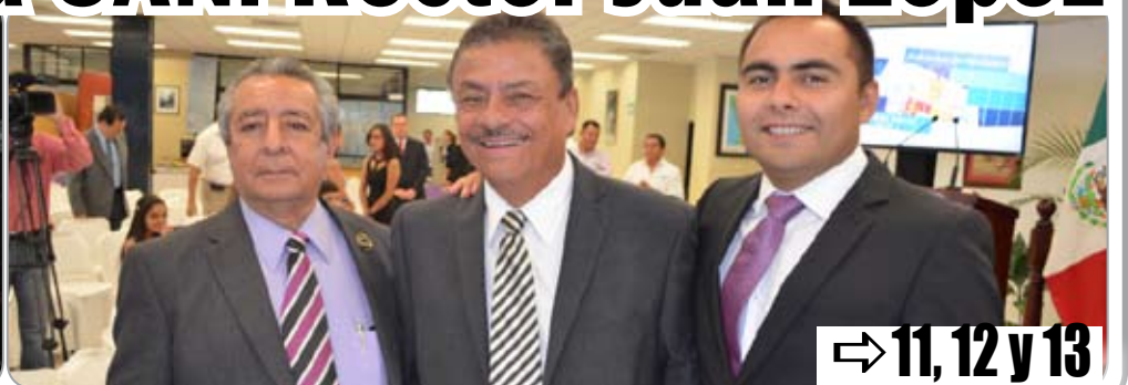
⇨ 11, 12 y 13