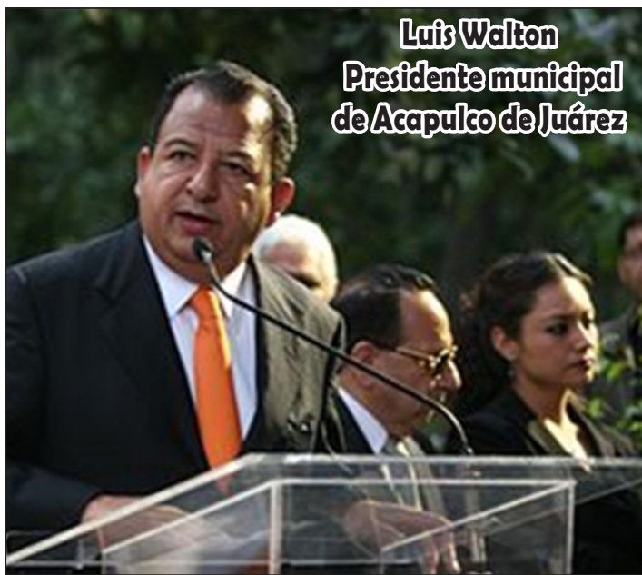
Luis Walton Presidente municipal de Acapulco de Juárez