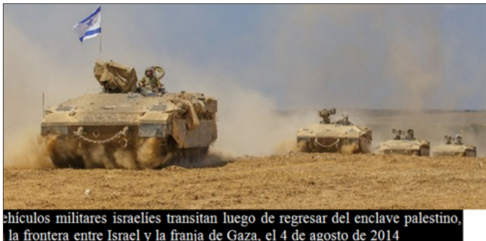
vehículos militares israelíes transitan luego de regresar del enclave palestino, la frontera entre Israel y la franja de Gaza, el 4 de agosto de 2014

La tregua busca poner fin a casi cuatro semanas de combates entre Israel y el grupo extremista Hamas, los cuales han cobrado la vida de 1,900 palestinos, la mayoría de ellos civiles. En la guerra también han muerto 67 israelíes, tres de ellos soldados.