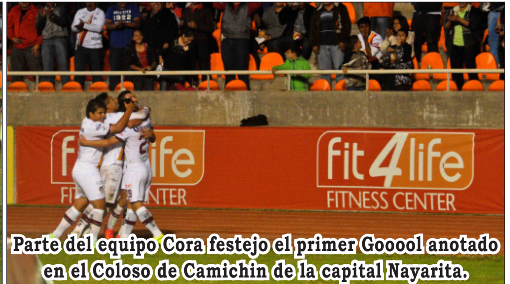
Parte del equipo Cora festejo el primer Gooooool anotado en el Coloso de Camichín de la capital Nayarita.