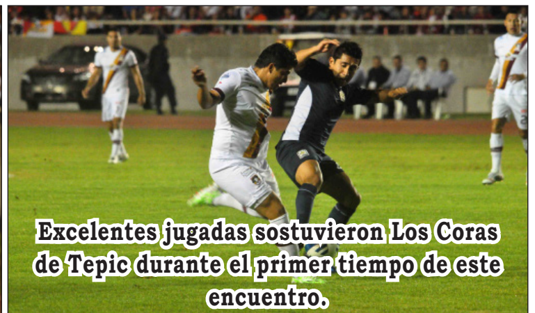
Excelentes jugadas sostuvieron Los Coras de Tepic durante el primer tiempo de este encuentro.