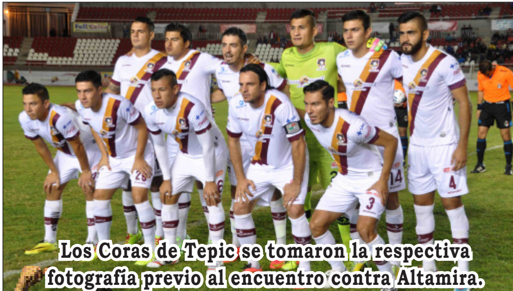
Los Coras de Tepic se tomaron la respectiva fotografía previo al encuentro contra Altamira.