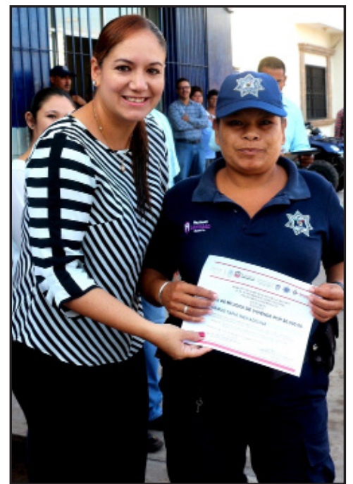
Ixcuintla, existe la confianza del gobierno en su policía y la población respira seguridad y tranquilidad”.