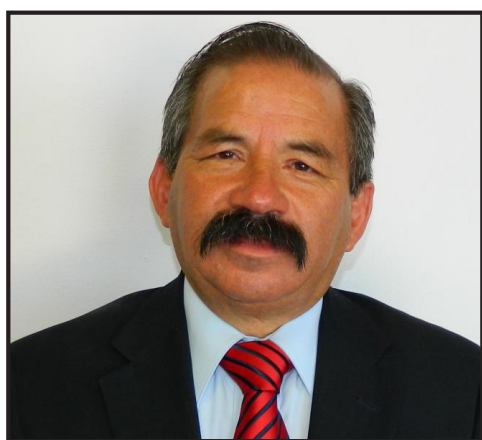
Por Juan Carlos Ceballos

(NO se autoriza la transcripción o copia de esta información a otros medios de comunicación. NO a copiar y pegar. NO al robo de notas)