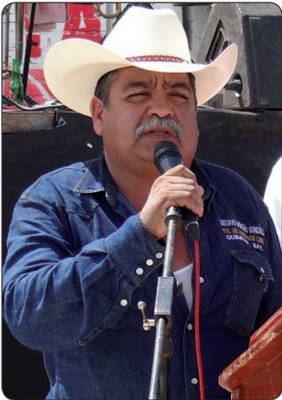
hombres de ese lugar en

Además también fueron premiadas con centenares de regalos que mercedamente recibieron por cooperación de todos los ejidatarios, cabe mencionar que la mayoría de los