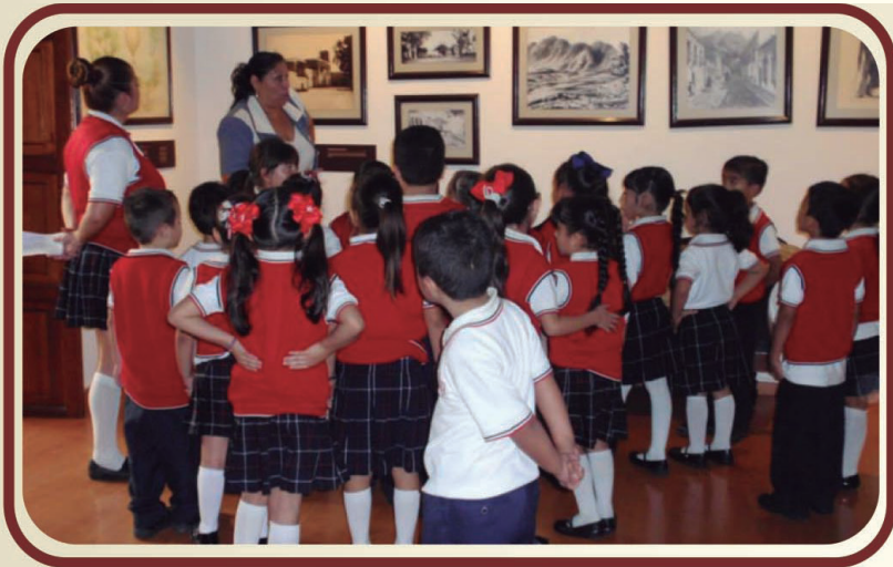
Visitas Guiadas a Escolares