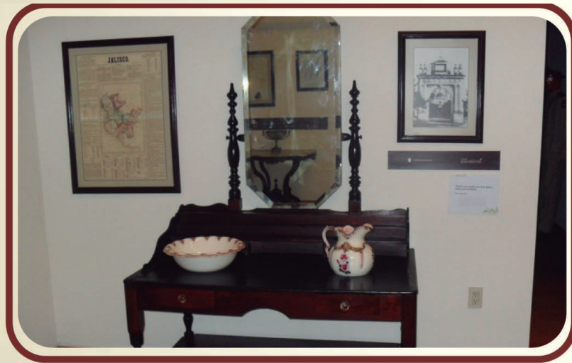
Muebles y utensilios del siglo XIX