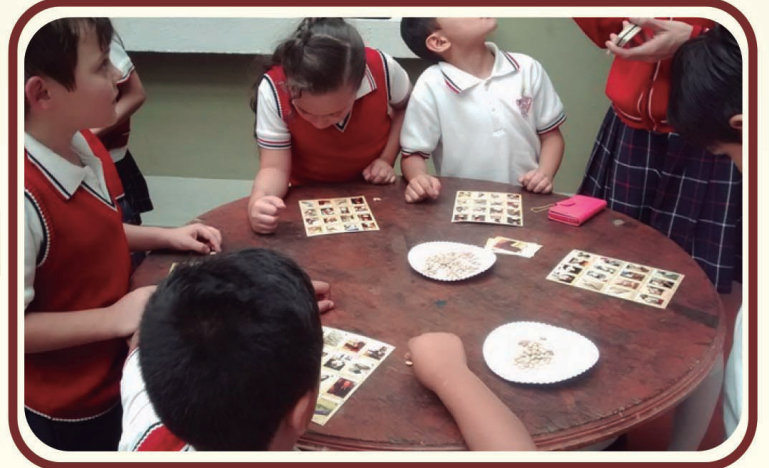
Lotería elaborada con los elementos museográficos del Museo