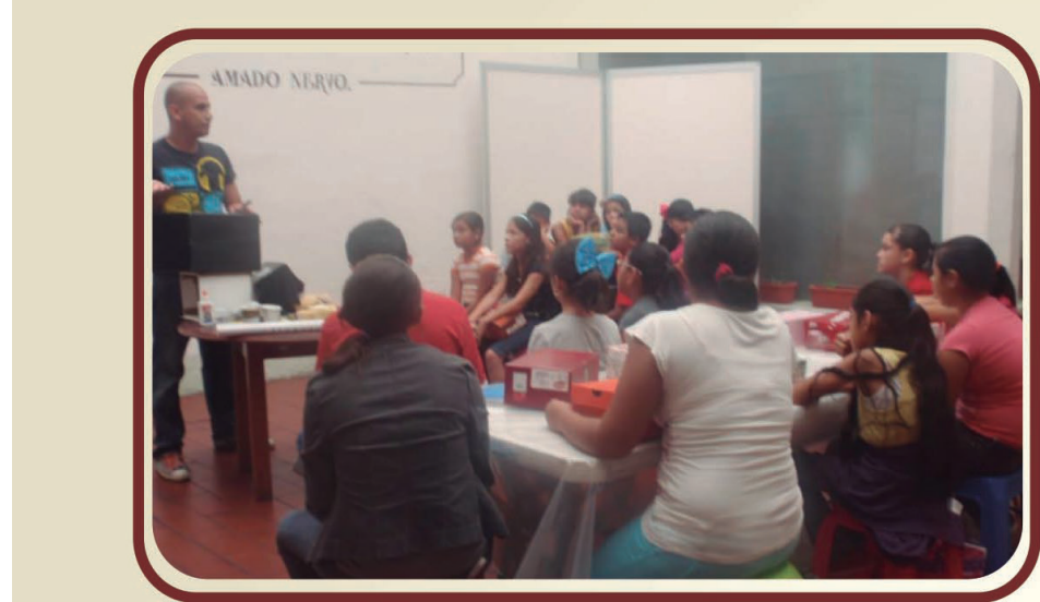
Cursos de Verano