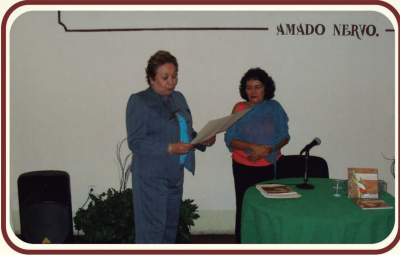
Presentaciones de Libros