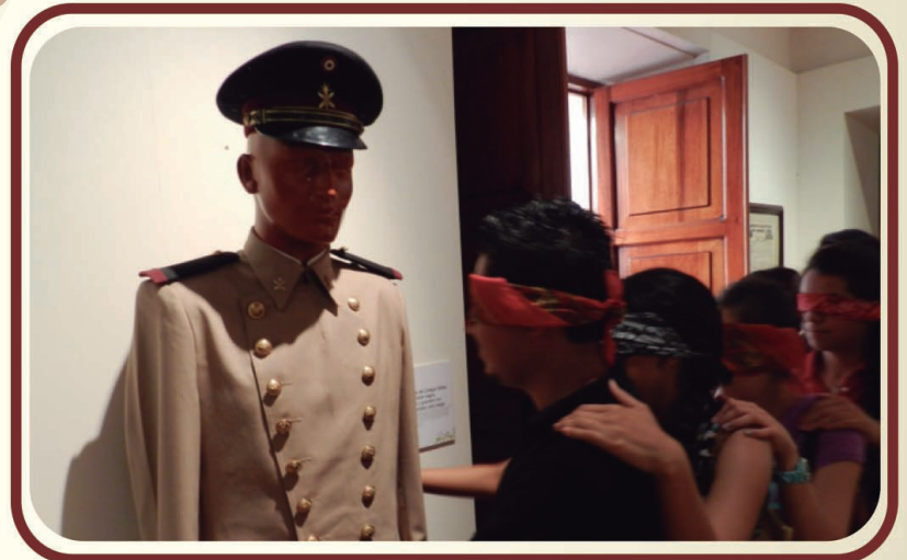
Visitas de sensibilización a estudiantes