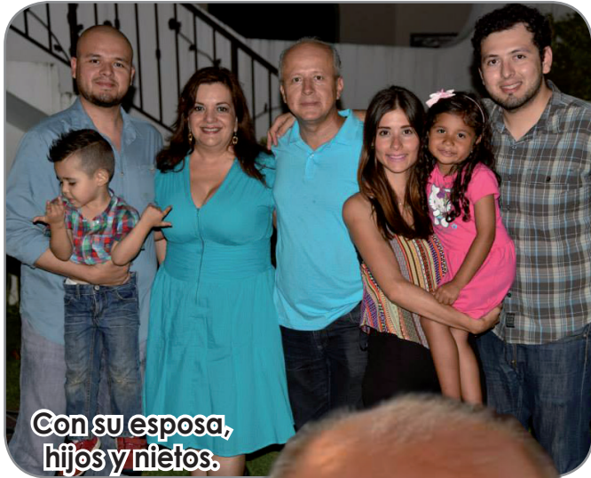
Con su esposa, hijos y nietos.