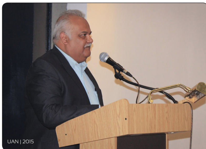
UAN | 2015

cifra de asistencia que se tuvo en la edición anterior de 8 mil visitantes, y que puedan convivir en los diferentes espacios de la institución, ya que se cuenta con más de 50 editoriales locales, nacionales y de distintas universidades públicas.