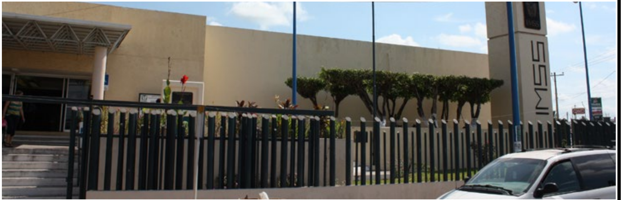
Tepic, Nayarit a 15 de junio de 2016