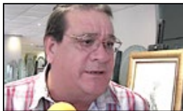
Por Juan Carlos Ceballos

Por último señalaremos, que la mencionada alcantarilla es propiedad de la empresa de clase mundial, o sea la Comisión Federal de Electricidad, Paraestatal, que ya se conduce bajo la nueva reforma energética, lo cual quiere decir que dicha reforma, no contempla entre sus normativas darle prioridad a los trabajos de alcantarillas descompuestas, sobre todo que están generando peligro a la gente.