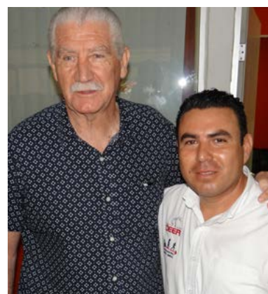
EN COORDINACIÓN CON INCUFID

REGIDORES DE SANTIAGO IXCUINTLA TRABAJARÁN