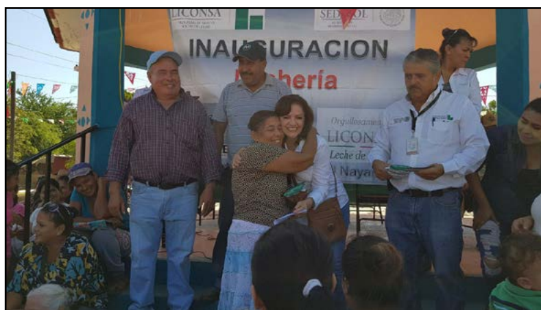
En esta nueva lechería, que se ubica en Cofradía

de la más alta calidad en nutrientes”. “Sabemos que nuestros pueblos tienen muchas necesidades, y apoyarlos es parte fundamental para mejorar el desarrollo social de la comunidad”, manifestó e informó que en esta lechería también se atenderá a las localidades de San Antonio, Santa Fe, San Marcos de Cuyutlán, y Pilas, con un total de 331 beneficiarios con 203 familias.