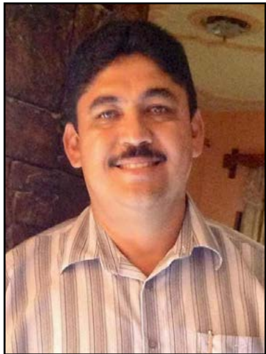
A pesar de la crisis económica en los ayuntamientos nayaritas, el presidente municipal de