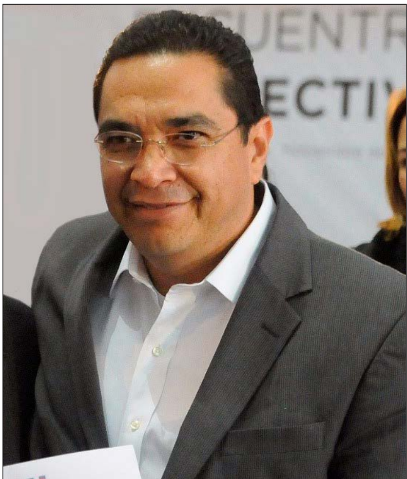
La dirigencia estatal del Partido Revolucionario Institucional confirmó que la Convención Estatal de Delegados y Delegadas que ratificará a sus candidatos al