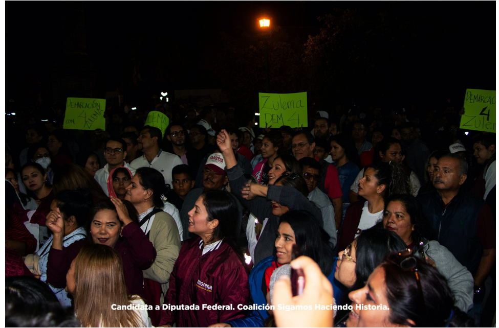
Candidata a Diputada Federal. Coalición Sigamos Haciendo Historia.