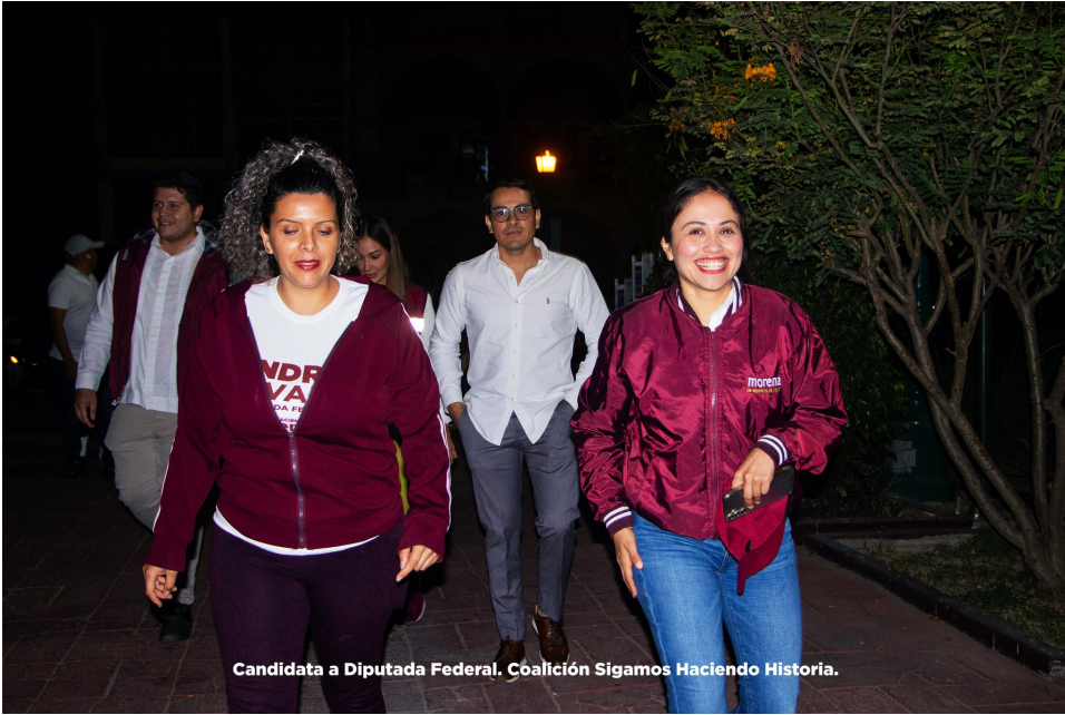
Candidata a Diputada Federal. Coalición Sigamos Haciendo Historia.