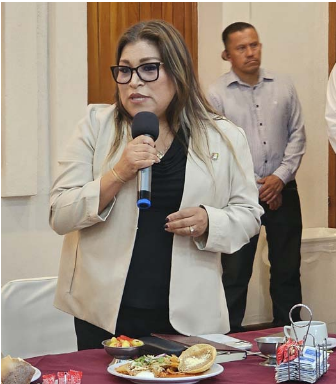
Mary Castro News

El Consejo Empresarial de Nayarit, CEN; celebró su primera sesión de trabajo del 2026 con la presencia de invitadas especiales que compartieron información en el propósito de fortalecer al sector empresarial con distintos apoyos y beneficios que ofrece el gobierno