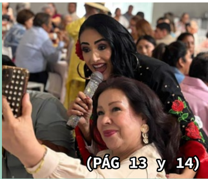
(PÁG 13 y 14)

La Güera Valdivia quiere nuevamente la alcaldía de Santiago