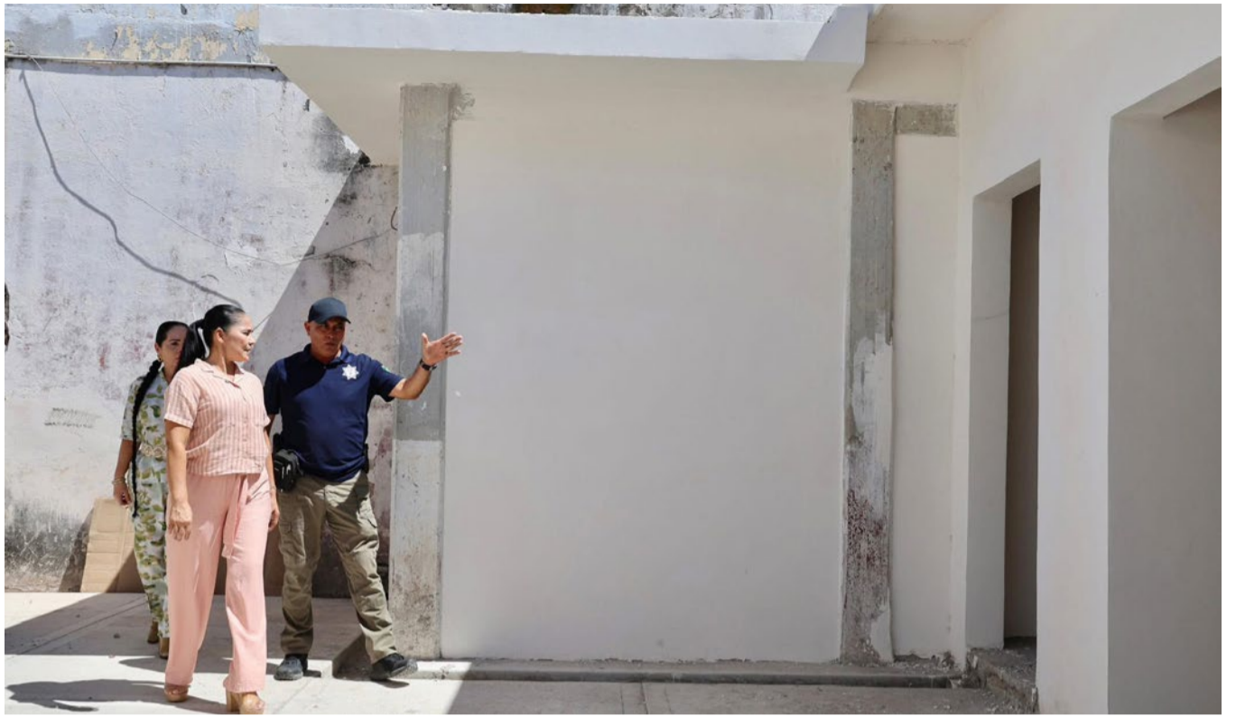
El Gobierno de Tecuala reafirma su compromiso de fortalecer espacios que contribuyan al orden y a una mejor convivencia para las familias tecualenses.

Además, contará con un equipo multidisciplinario integrado por juez o jueza cívica, personal de secretaría, auxiliares y servicio médico, con el propósito de brindar atención eficiente y cercana a la ciudadanía.