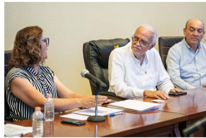
Nayarit Gastro Fest 2026